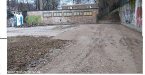
Nach Umgestaltung wird die Fläche zu einem kulturellen Treffpunkt