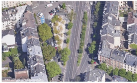
Gallusgarten II in der Mitte der Frankenallee