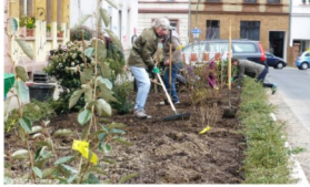
Gemeinschaftsgarten auf der Friedberger Landstraße